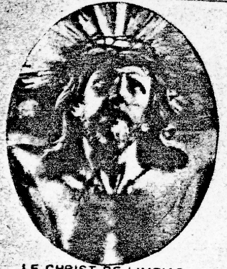
LE CHRIST DE LIMPIAS

Le jour où se termine le temps de Pâques, les baptisés sont, une fois de plus, séparés en deux catégories : ceux qui ont eu leur Dieu et... les autres. D'un côté, ceux qui ont renou- velé leur vie surnaturelle, de l'autre côté, ceux qui sont restés à l'écart.